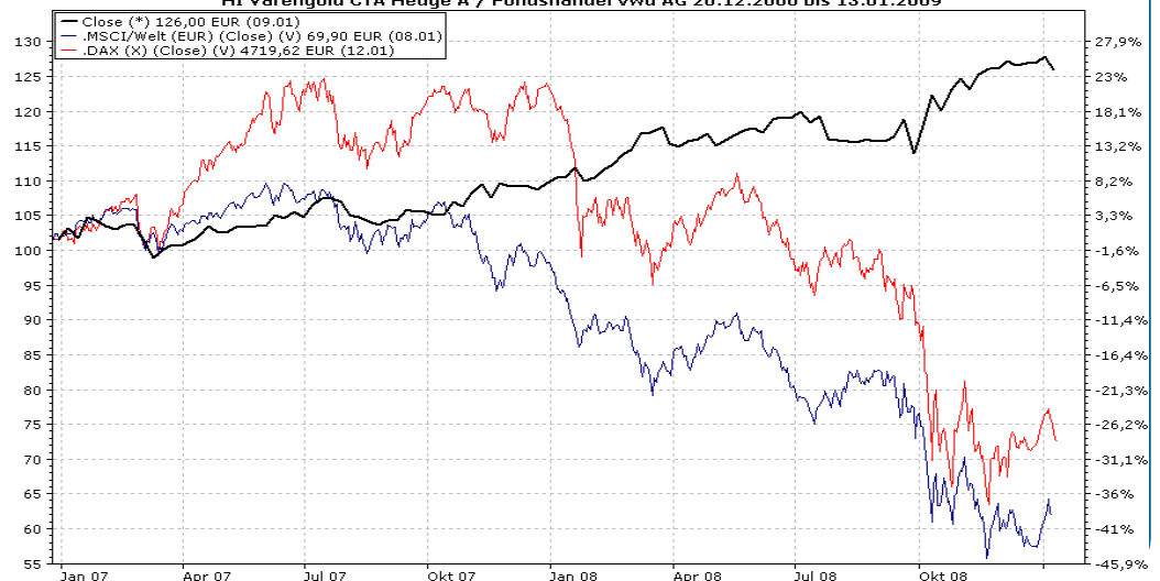
HI Varengold CTA Hedge A / Fondshandel vwd AG 26.12.2006 bis 13.01.2009

Disclaimer: Bei den dargestellten Informationen handelt es sich um die unveränderte Weitergabe einer Analyse bzw. eines Marktberichts von Dritten. Für den Inhalt ist daher ausschließlich der jeweilig angegebene Ersteller verantwortlich. Die SRQ FinanzPartner AG übernimmt für den Inhalt, die Richtigkeit, Vollständigkeit und Aktualität der Informationen keine Gewähr. (Quelle: Varengold Wertpapierhandels Bank AG) Alle Informationen wurden mit größtmöglicher Sorgfalt recherchiert und erstellt. Dennoch kann für die Richtigkeit keine Gewähr übernommen werden. Eine Haftung für den tatsächlichen Eintritt wirtschaftlich prognostizierter Ergebnisse und steuerlicher Wirkungen wird ausdrücklich ausgeschlossen. Vor einer Anlageentscheidung ist in jedem Fall ein persönliches Gespräch mit Ihrem SRQ-Finanzplaner erforderlich, der Ihnen die Chancen- und Risiken der dargestellten Produkte ausführlich erläutert