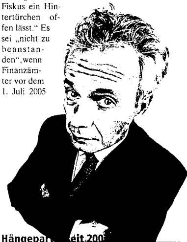
Hängeparagrafen seit 2001

Die Tragweite des Urteils des Bundesfinanzhofs (BFH) vom 9. Oktober 2003 war in weiten Teilen der Finanzbranche zunächst nicht erkannt worden. Das Urteil befasste sich ursprünglich nur mit der Kreditvermittlung. Die BFH-Richter entschieden, dass Vermittlungsprovisionen bei der Kreditvermittlung nur dann umsatzsteuerbefreit sind, wenn zwischen dem Kreditvermittler einerseits und entweder dem Kreditgeber oder dem Kreditnehmer andererseits ein entgeltlicher Geschäftsbesorgungsvertrag geschlossen worden ist und dieser die Grundlage der Vermittlungstätigkeit und der Provisionszahlung ist. Damit sind Untervermittlerverhältnisse und mehrstufige Vertriebe von der Umsatzsteuerpflicht betroffen. Als portfolio international schon frühzeitig darauf hinwies, dass die neue Definition des Vermittlerverhältnisses über die Kreditvermittlung hinausgeht und auch Fondsanteile betrifft, wollten das einige Vertriebschefs zunächst nicht wahrhaben und zogen den Autor der Panikmache. Ein Jahr später bestätigte das Finanzministerium mit seinem Schreiben aber exakt diese Voraussetzungen und schloss die Anteilsvermittlung mit ein. Einige große Vertriebe suchen seitdem nach alternativen Geschäftsmodellen, um eine Mehrstufigkeit zu vermeiden.